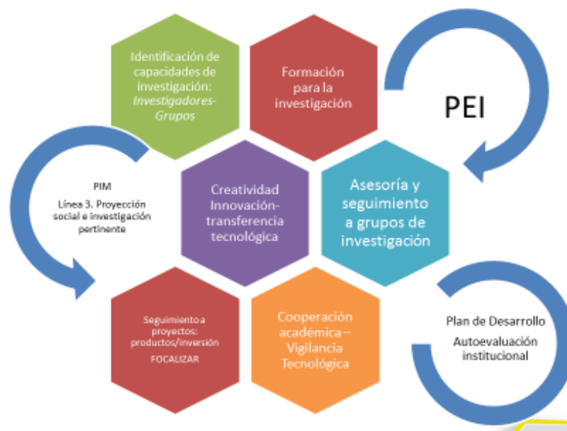
Figura 1. Gestión de la Investigación Universidad Santo Tomás 2017, en el marco del PIM y el Plan de Desarrollo y la Autoevaluación Institucional.

En el marco de la línea 3 del PIM: Proyección social e investigación pertinente y el Plan de Desarrollo Bogotá , se han obtenido importantes logros en la articulación de la investigación con la visibilidad y el impacto nacional y global. De esta forma se realizó un análisis y seguimiento de las capacidades de talento humano, proyectos, líneas de investigación e identificación de los campos de acción, lo que condujo a la implementación de diferentes estrategias de visibilidad e impacto de la producción académica; dichas estrategias permitieron que hoy la Universidad Santo Tomás se encuentre dentro de las primeras 20 universidades del país en el Ranking Mundial de Investigación en Universidades, elaborado por Scimago Institutions Rankings y presentado en Colombia por Universia. De la misma forma, se modificaron los términos del Fondo de Desarrollo de la Investigación (Fodein), con el fin de incentivar las buenas prácticas de la investigación, estimulando: la cooperación y el trabajo en redes, el trabajo interdisciplinario, la gestión de recursos externos a la institución, la consolidación de un sistema de investigación multicampus, la articulación con las funciones sustantivas, entre otras. Lo anterior se sustenta en la formación para la investigación, a través del Seminario Internacional de Profundización en Investigación , y la consolidación de estrategias para fortalecer la innovación, la creatividad y la transferencia tecnológica.